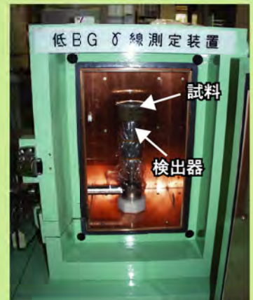
[ゲルマニウム半導体検出器]

前処理を行った後、試料はきわめて低いレベルまでガンマ線を測定できるゲルマニウム半導体検出器で測定します。