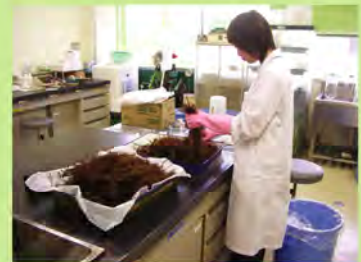
[ホンダワラの前処理]

採取された環境試料は、効率のよい測定を行うため、濃縮や乾燥、灰化等、試料の前処理を行い、容積を減らします。